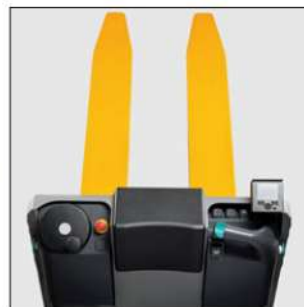
Elementi di comando e display supplementare in direzione di carico (opzionale)