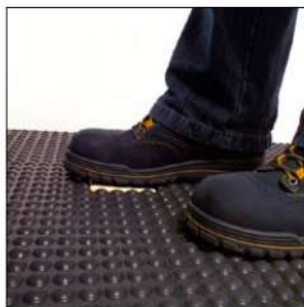
Pedana rivestita in gomma per un maggiore comfort dell'operatore