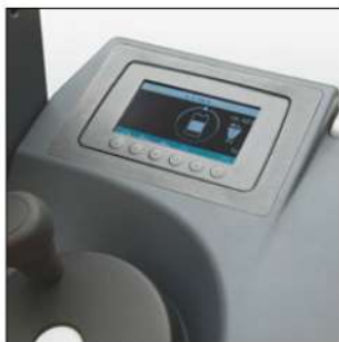
Display informativo per l'operatore