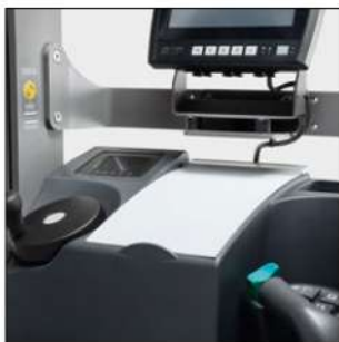
Posto operatore ergonomico